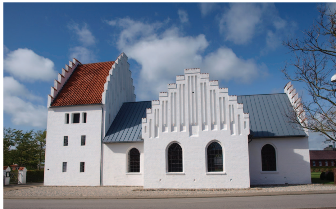
Marie-kirken i Bøvlingbjerg, tæt på Lemvig i Viborg Stift. Her holder Bøvling Valgmenighed til

DER ER IKKE så langt fra Valsbøl over Paris til Bøvlingbjerg som man skulle tro! Nok er Eiffeltårnet skiftet ud med DTU's vindmøller, som dog også blinker om natten. De tyske og franske gloser er skiftet ud med de vestjyske, og ordet grænseland er vejet for udkant og vandkant. Der er tale om tre slags mindretalskirker; den historisk forankrede, den dansk/protestantiske kirke i et fransk