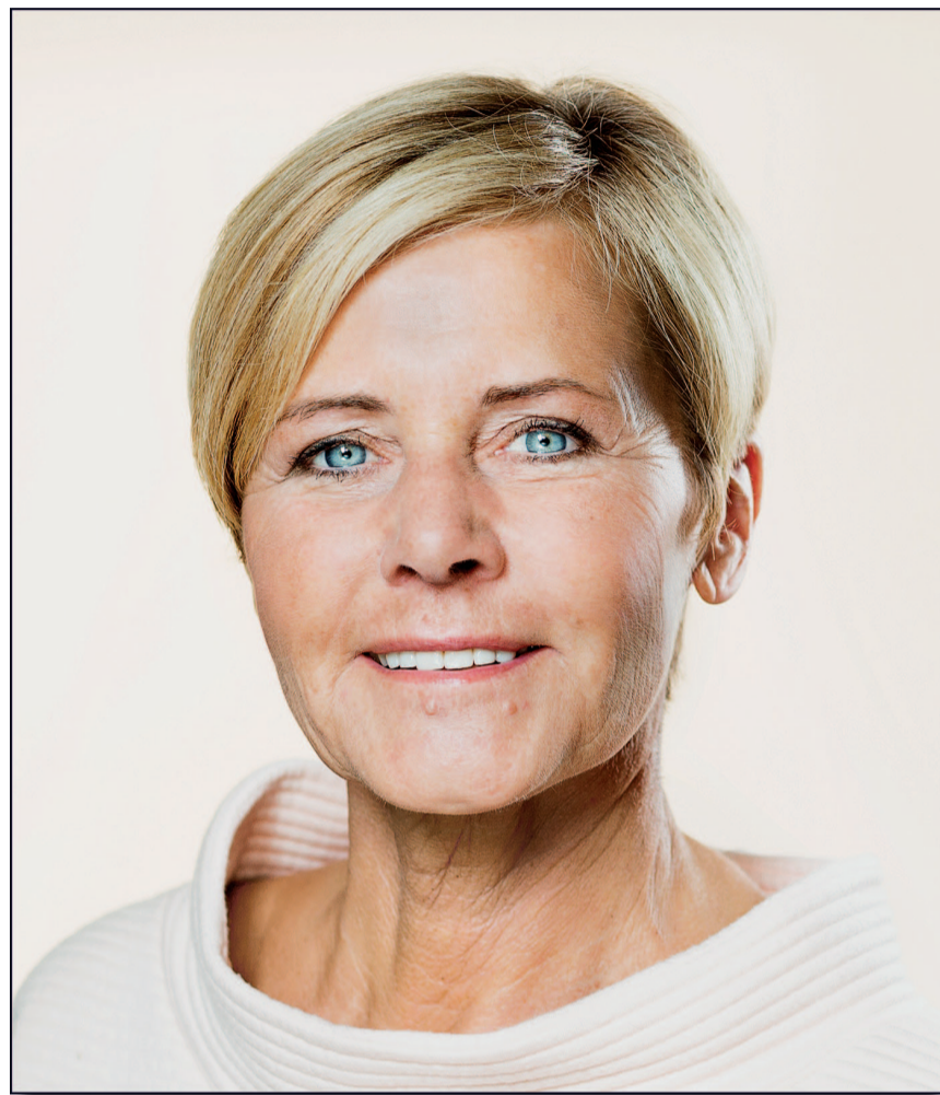
Minister for kirke og kultur, Mette Bock.

Når man nu bladrer igennem festhilsenen bliver man næsten forpustet over de mulige rødder og linjer, der kan trækkes fra reformationens afsæt i begyndelsen af 1500-tallet og op til