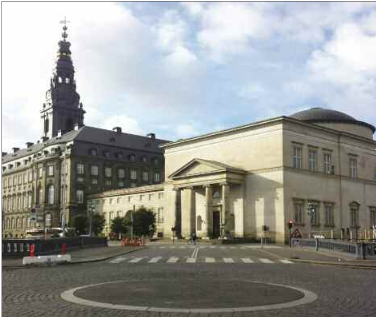
STAT og KIRKE, her Christiansborg og Christiansborg Slotskirke.